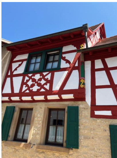
Eckpfosten der mittelalterlichen Synagoge mit Palmwedel